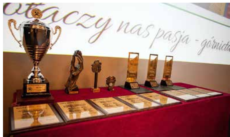
Nagrody Szkoły Eksploatacji Podziemnej 2015