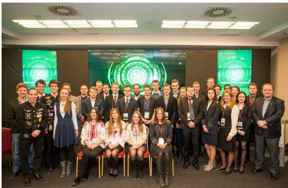
„Rodzinne” zdjęcie uczestników III MWSM Kraków

Ostatniego dnia obrad studenci mieli okazję pochwalić się kolegom osiągnięciami swojego kraju w dziedzinie górnictwa. Przedstawiciele danego kraju przedstawiali prezentację odnośnie historii, stanu obecnego oraz przyszłości sektora górniczego w ich ojczyźnie.