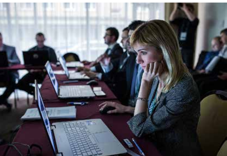
Uczestnicy szkoleń IT

Z otrzymanych przez organizatorów informacji i podziękowań można wnioskować, iż szkolenia odebrane zostały bardzo pozytywnie zarówno ze strony uczestników, jak również prowadzących. Były one miejscem zetknięcia się problemów polskiego górnictwa z trendami górnictwa światowego. W trakcie szkoleń wielokrotnie wywiązywały się dyskusje, które pozwoliły na wymianę doświadczeń. Można śmiało powiedzieć, że podczas zorganizowanych szkoleń panowała atmosfera, którą można opisać dewiza SEP 2015: „Niech połączy nas pasja – górnictwo”. Z niecierpliwością oczekujemy następnych edycji Szkoły Eksploatacji Podziemnej, z nadzieją, że wzorem SEP 2015 praktyczne szkolenia na stałe wpiszą się w jej program.