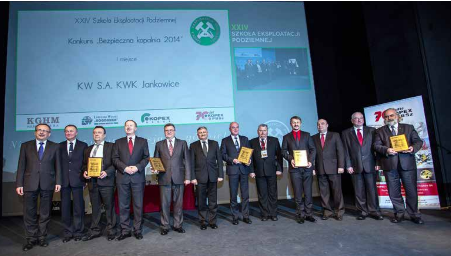
Organizatorzy i laureaci konkursu Bezpieczna Kopalnia

czynnie uczestniczą w wyłanianiu najbezpieczniejszej kopalni.