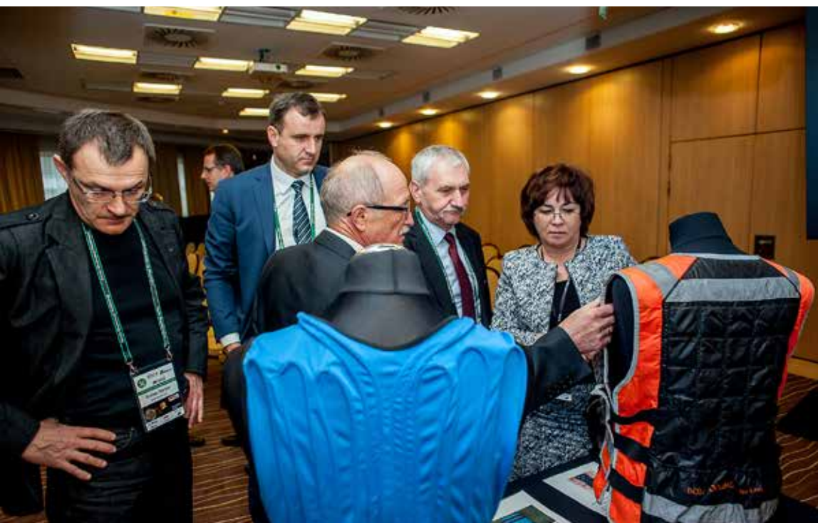
Prezentacja specjalistycznego sprzętu ochrony osobistej użytkowanego przez KGHM Polska Miedź S.A.