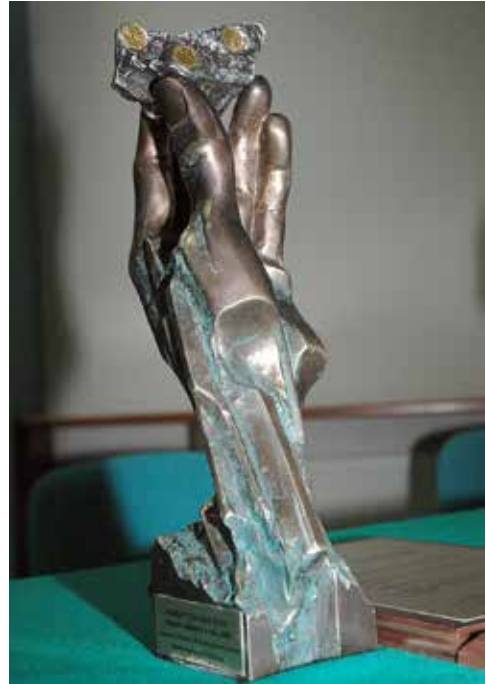
Statuetka Kopalnia Roku

Natomiast w roku 2015 Złotym Sponsorem Szkoły Eksploatacji Podziemnej zostało Przedsiębiorstwo Budowy Szybów KOPEX PBSz S.A.