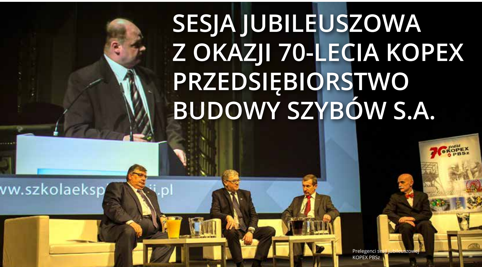
Prelegenci sesji jubileuszowej KOPEX PBSz

Po raz kolejny konferencja Szkoła Eksploatacji Podziemnej stała się miejscem świętowania jubileuszu działalności firmy od wielu lat ściśle związanej z przemysłem górniczym zarówno w Polsce, jak i na świecie. Tym razem to firma KOPEX Przedsiębiorstwo Budowy Szybów S.A. obchodziła jubileusz 70-lecia swojego istnienia.