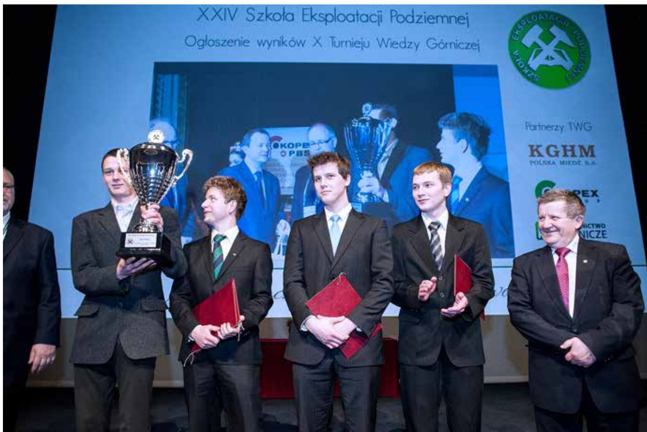
Organizatorzy i Laureaci X Turnieju Wiedzy Górniczej

Z niecierpliwością oczekujemy kolejnej edycji WMSM w Krakowie i emocji związanych z rywalizacją w Turnieju Wiedzy Górniczej.