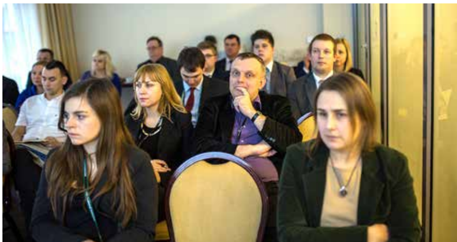
Słuchacze podczas prelekcji