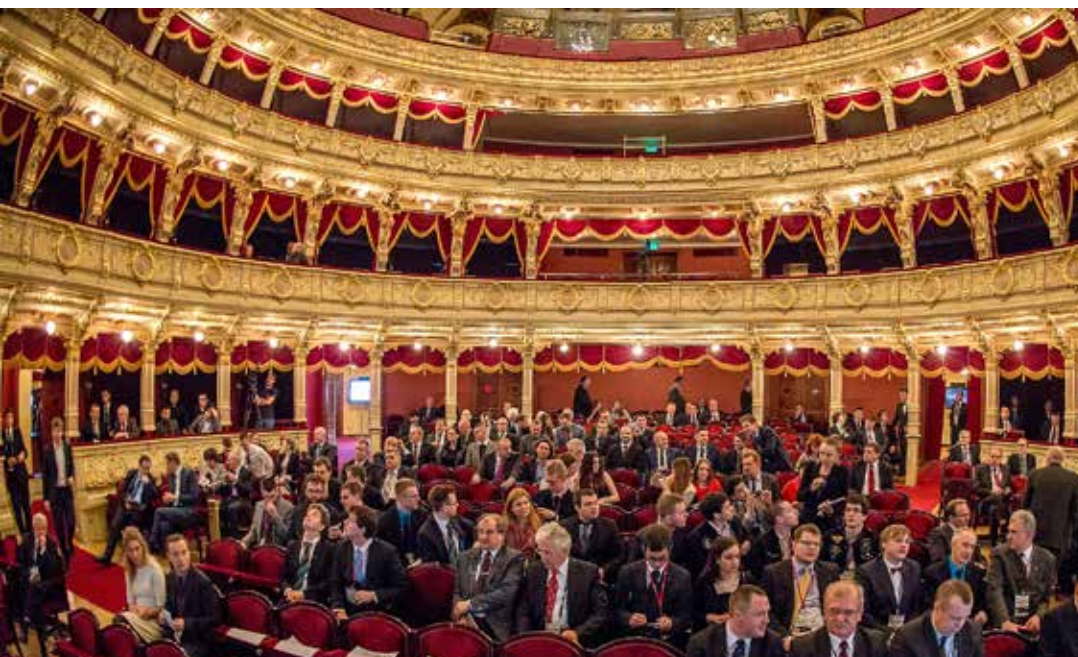
Widownia jubileuszowej sesji 70-lecia KOPEX PBSz w Teatrze Słowackiego w Krakowie

Analizując działalność SEP na przestrzeni lat można zauważyć, że wiele firm zaufało organizatorom i wybrało właśnie tę, największą konferencję górniczą w Polsce, jako idealne miejsce do przeżywania kolejnych jubileuszy swojej działalności. Mamy nadzieję, że kolejne lata przyniosą następne jubileusze, które będziemy mogli razem z Państwem świętować podczas obrad Szkoły Eksploatacji Podziemnej.